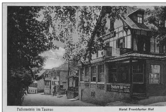
Hotel „Frankfurter Hof“, alte Ansichtskarte