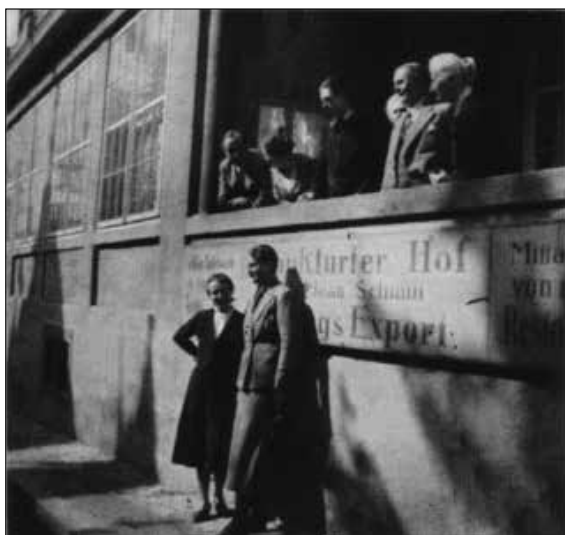
Gäste mit Betreuerinnen vor dem „Frankfurter Hof“, 1934