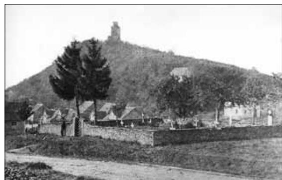
Alter evangelischer Friedhof an der heutigen Feldbergstraße.

Auch eine eigene Begräbnisstätte, einen „Todtenhof“ wurde den Evangelischen zugestanden und am Rande des „Bornackers“ angelegt und bis zur Errichtung eines Gemeindefriedhofs 1897 benutzt. Die kleine Anlage mit den noch zwei vorhandenen Gräbern oberhalb des Ehrenmals zwischen Nüringstraße und Feldbergstraße gibt