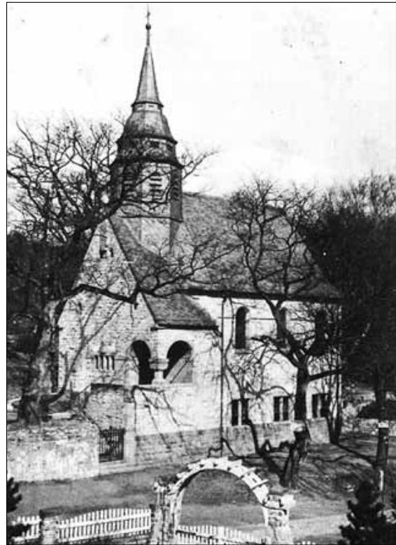
Die neue evangelische Kirche (vom Offiziersheim aus gesehen)

Sehr oft dürfte das alte Lutherlied „Verleih uns Frieden, gnädiglich, Herr Gott zu unsern Zeiten“ in der neuen Kirche erklingen sein, während sich in Europa, in der Welt eine neue große Katastrophe anbahnte.