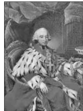
Kurfürst und Erzbischof von Mainz Friedrich Carl Joseph von Erthal