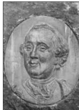
Fürst Carl von Nassau-Usingen