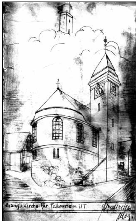
„Evangelische Kirche für Falkenstein“; Am Hainberg ca. 1910, Zeichnung (privat)

Dies wäre zwar juristisch einfacher gewesen, hätte aber wohl beim Bau und – vor allem aus heutiger Sicht – hinsichtlich der Verkehrsführung in der Hauptstraße große Probleme zur Folge gehabt.