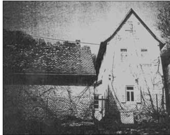
Ehemaliges Schul- und Bethaus der evangelischen Gemeinde, Auf dem Hainberg (altes Foto)

Schule im Rathaus, eine evangelische auf dem Hainberg und eine Judenschule im Unteren Bergweg. Hierin liegt die große Besonderheit der Falkensteiner Schulgeschichte z. B. gegenüber der zum Kurfürstentum Mainz gehörenden Stadt Königstein, die eine einzige katholische Schule hatte.